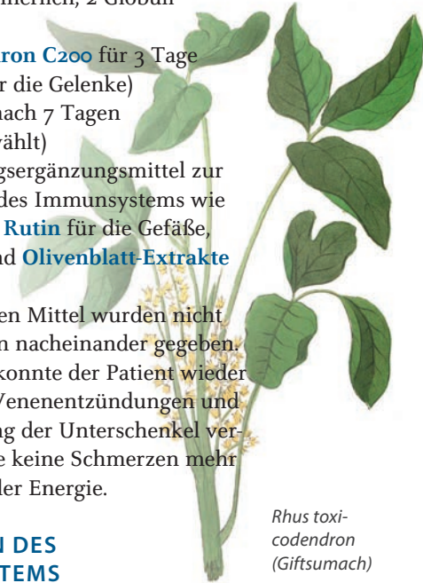
Rhus toxicodendron (Giftsumach)