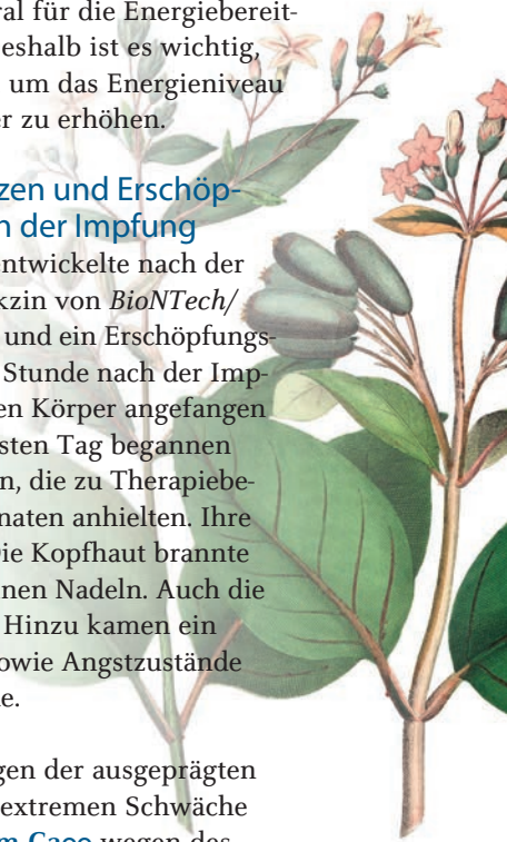
China officinalis (China-rindenbaum)

Herpes-Infektionen wie Herpes zoster (Gürtelrose) können unmittelbar nach einer Corona-Impfung auftreten. Dies ist möglicherweise dadurch zu erklären, dass der Körper in dem Moment, in dem er gegen einen bestimmten Virusstamm geimpft wird, zu geschwächt ist, um auf andere Viren reagieren zu können (sogenannte Virusinterferenzen). Sehr häufig wird z. B. auch eine Papillomavirus-Infektion (HPV) oder eine